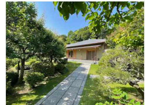
Temple Zenkyoin à Kamakura