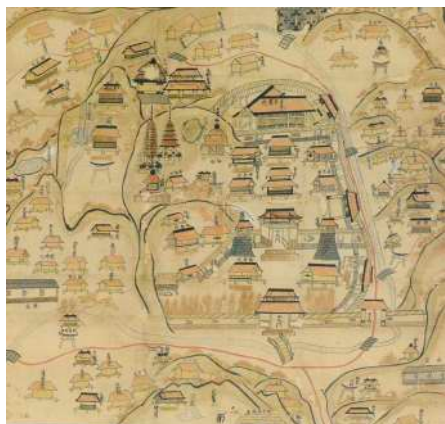
昔の極楽寺の図 忍性生誕800年記念特別展 図録より引用

「当日散策ノート」と「相州鎌倉今昔絵図」とともに、滞在先ホテルでの受け取りをご希望の方には、メールでPDFをご送付します。