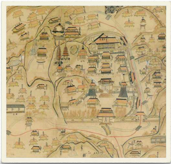
昔の極楽寺 忍性生誕800年記念特別展 図録より引用

お申し込み：9月15日(木)まで ホームページ、メール、電話:03 5758 3875にて お申し込み下さい。(月火定休) 請求書をご送付し、参加費お振込により予約完了 となります。 感染予防対策を実施しての開催となります。