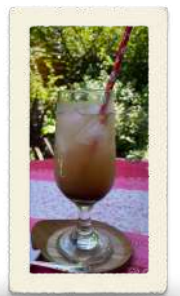
クラフトコーラ「坂ノ下の馬コーラ」